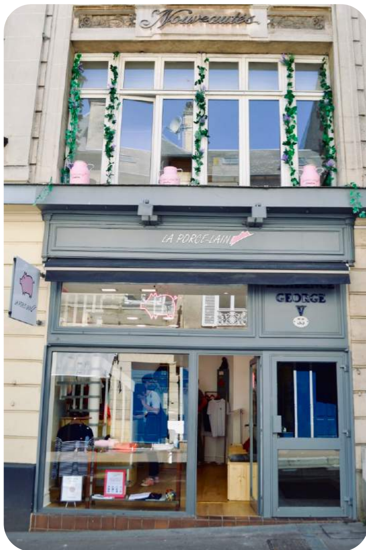
Magasin La Porce-Laine, 33 rue saint martin 14400 Bayeux

Leur gamme " La Porce-Laine Création" offre un large choix et est directement imprimé en magasin sous les yeux du public en quelques secondes.